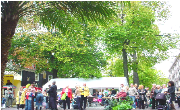
Wijkcentrumjubileumfeest op de Palmgracht