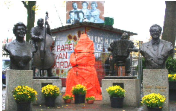
Veel Jordaanwandelingen eindigen op het Johnny Jordaanplein