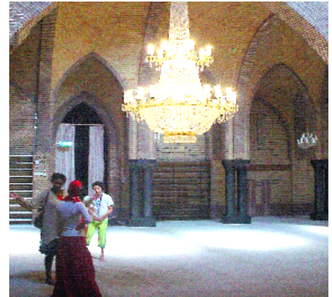
De monumentale Fatih Moskee aan de Rozengracht is net als de Aya Sofia in Istanbul gebouwd als Rooms Katholieke kerk