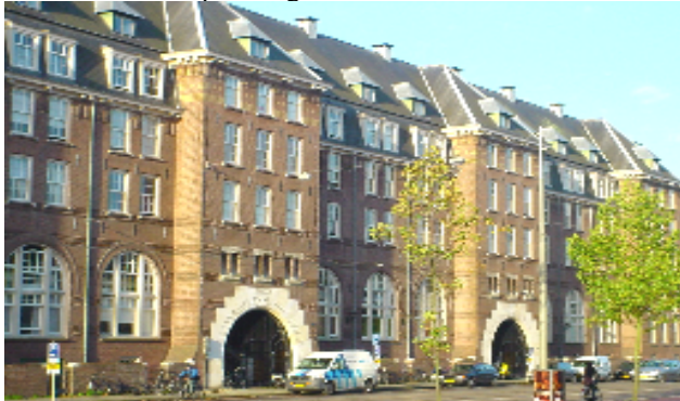
Eén van de excursies van de Buurtconferentie voert naar het ATVA 5

Met de Jordaancanon, gelanceerd op het 50-jarig jubileum van het Wijkcentrum, heeft de enige buurt die in de Dikke Van Dale staat als eerste ook zijn eigen canon: een handzaam overzicht van personen, gebeurtenissen, bouwwerken en ontwikkelingen, die samen laten zien hoe de Jordaan zich ontwikkelde tot de buurt waarin we nu leven. Het boekje, met een voorwoord van Mies Bouhuys, vertelt hoe de buurt veranderde van drassig boerenland in een dicht opeengepakte fabrieks- en volksbuurt, van toevluchtsoord voor geloofsvolgers uit Frankrijk tot broedplaats en toneel van volksoproeren tegen armoede en onderdrukking, van bakermat van sociale woningbouw en sociaal werk en van veelbezongen achterstandswijk tot de prachtwijk van nu, maar altijd Jordaan gebleven. Daarbij passeren tal van thema's die de Historische Canon van Nederland niet hadden misstaan: de hofjes, de Woningwet, de sociale woningbouw, de stadsvernieuwing, de grote oproeren, het eerste buurthuis van Nederland en de legendarische Jordaanartiesten. Aan de hand van het kaartje kan alles ook ter plekke gevonden en bewonderd worden.