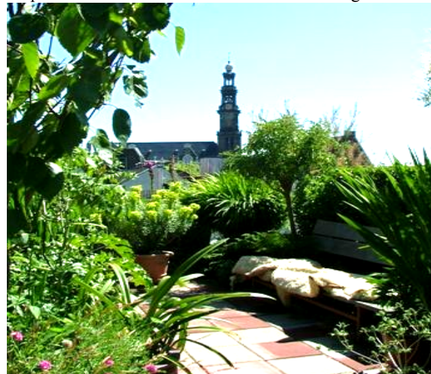
Open Tuinen Dag: de Westertoren zoals u hem nooit zag

De Dag van de Architectuur 25 en 26 juni heeft als thema ‘Zelfverzonnen’. Het gaat over wat niet-officiële ontwikkelaars tot stand kunnen brengen, over bottom-up initiatieven, bedacht uit gedrevenheid, betrokkenheid of engagement. Buurtbewoners redden talloze panden van de sloop, die door institutionele ontwikkelaars, overheid en corporaties veelal als onontkoombaar was voorgesteld.