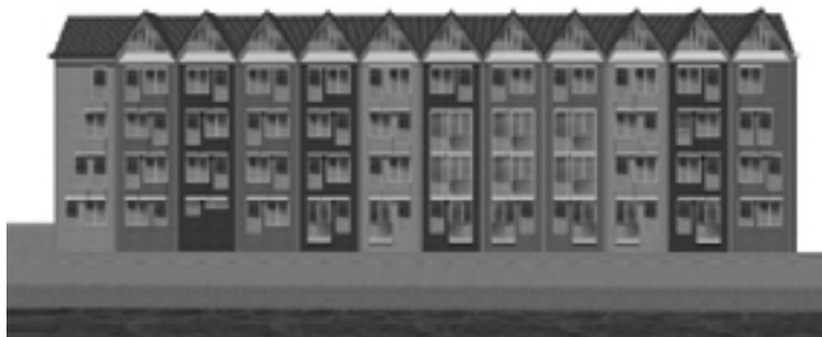
De toekomstige gevel van de Rietvinck aan de Brouwersgracht (Architect Marc Prosman)

28 januari Stand van zaken Rietvinck en Bernardus, gastspreker Ko Hemminga, Osira Groep Thema Woonservicebuurt Vaststelling Begroting 2008 Nieuws uit de wijken