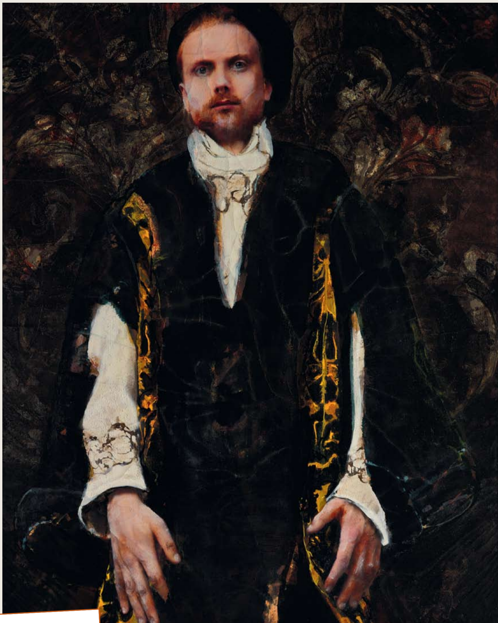
Olieverf op linnen (250 x 200 cm), 2015