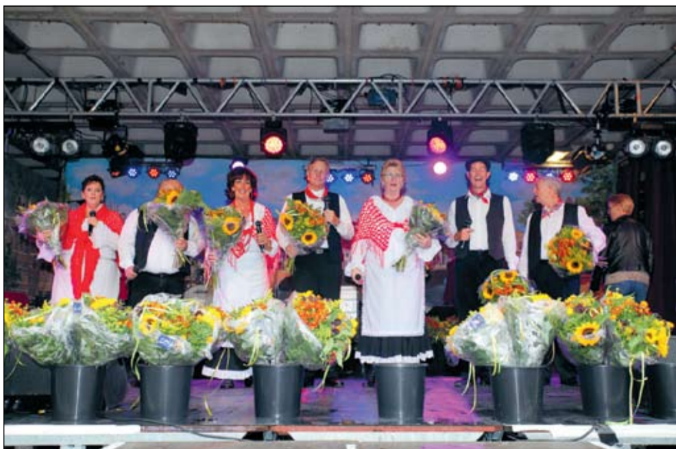
Het Jordaanensemble zingt straks uit volle borst op het Jordaan Festival