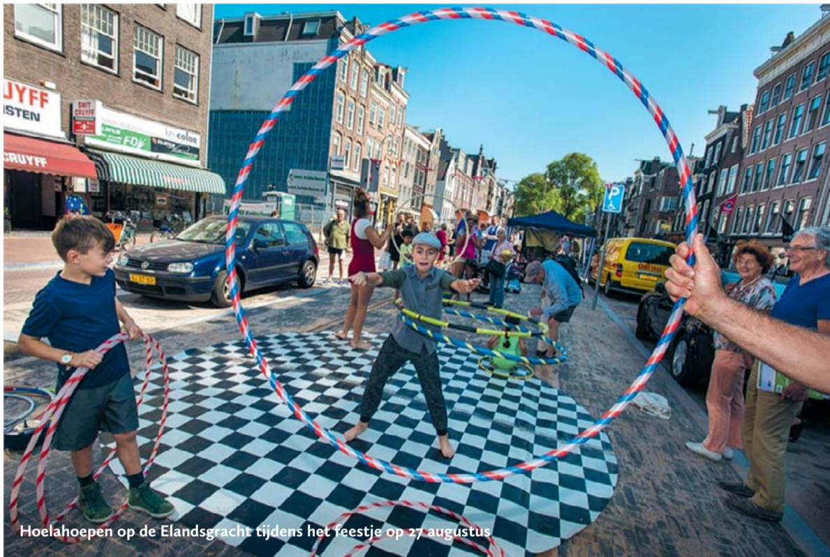
Hoelahoepen op de Elandsgracht tijdens het feestje op 27 augustus