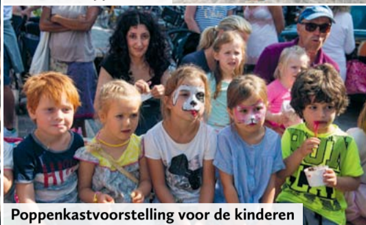
Poppenkastvoorstelling voor de kinderen