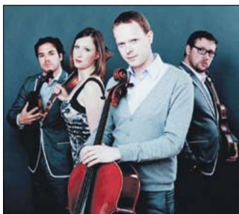
Matangi Kwartet: boegbeelden van een nieuwe generatie klassieke musici

Meer informatie en kaarten reserveren: www.noorderkerkconcerten.nl of tel 6204415. Voorafgaand aan de concerten zijn er ook kaarten verkrijgbaar aan de zaal (tenzij uitverkocht). Kinderen t/m 12 jaar hebben gratis toegang en jongeren t/m 21 betalen slechts 5 euro.