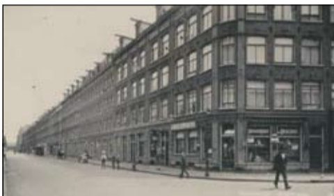
Barentzstraat hoek Zoutkeetsplein, ca. 1929