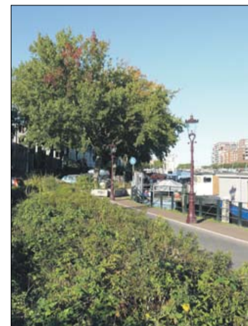
Op de foto hierboven de Kindertuin in de Ketelmakersstraat. Op foto hieronder de Bloemenspeeltuin aan de Bickersgracht. Er zijn meer helpende handen nodig voor het onderhoud van beide tuinen.