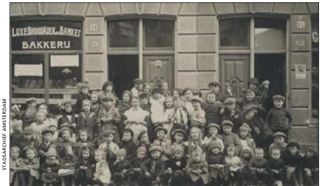
Een groep kinderen in de Barentzstraat voor de Luxe Brood- Koek- en Banketbakkerij op nummer 91 (ca. 1920)

Op de hoek Houtmankade en Zoutkeetsplein was en is nog steeds de scheepsartikelenwinkel, toen 'Parson', nu 'De Leeuw'. Daar hing altijd een carbolineumlucht – of was het teer?