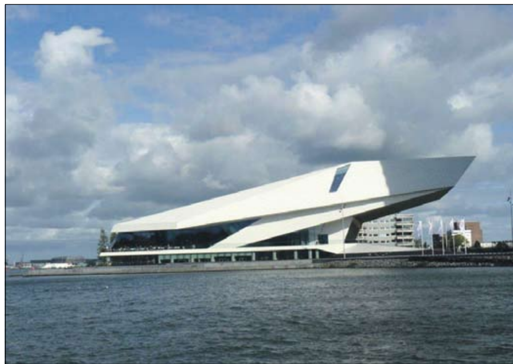
Filmmuseum EYE in Noord. In de Basement (free entrance) de Pods en de Playground.

Helaas staat het Bureau Amsterdam met dit begrip van de gastvrijheid niet alleen. Of tenminste: in Amsterdam en in Nederland staat het niet alleen. Ik doe een beperkte greep. Het Filmmuseum, zoals dat sinds kort in het toch nauwelijks Engelstalig te noemen Amsterdam-Noord gevestigd is, heet tegenwoordig EYE (mijn woordenboek leert: 'OOG'), en wijst zijn bezoekers de weg door het gebouw in ééntalig Engelse termen. Weliswaar is er ook een host te vinden die er de weg al weet en die ook het Nederlands machtig is. Het eveneens door Nederlandse publieke fondsen in leven gehouden New Art Space Amsterdam , gevestigd op het oude WG-terrein, doet met zijn invitations en press releases al vanaf zijn begin als Smart Project Space alsof het op Manhattan is gevestigd. Gewoon nogal belachelijk dus, hoewel verre van uitzonderlijk. Maar ik vraag me er ook nog iets over af. Wat verbeelden die ambtenaren en die cultuurstrategen zich eigenlijk? Dat het publiek dat hen financiert beleefd opzij wil stappen voor de anderhalve buitenlandse bezoeker die zich langs deze weg door hen zou willen laten vangen? Behalve arrogant en wereldvreemd