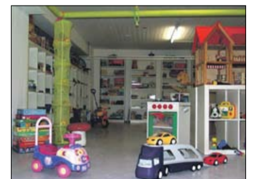
Het speelgoed is gereinigd en gecontroleerd.

Amsterdammers met een Voedselbankpas kunnen met hun kinderen (tot 10 jaar) speelgoed