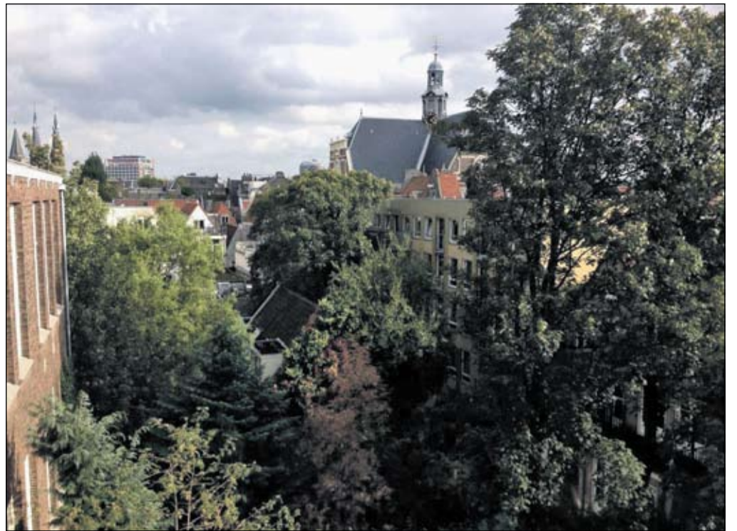
De Groene Tuin biedt veel vogels veilige huisvesting in een dicht bebouwde omgeving.

Bij de wethouders Oranje en Rengelink zijn de argumenten van Denktank Groene Tuin nu in zoverre aangeslagen, dat zij na een bezoek aan het gebied hebben toegezegd alles in het werk te stellen om zoveel mogelijk natuurschoon te behouden. Maar daarvoor zullen nog wel veel ambtelijke hindernissen moeten worden genomen. Want de in veertig jaar verworven rechten van omwonenden en andere betrokkenen kunnen via allerlei ambtelijke en bureaucratische regels worden gefrustreerd. Denk bijvoorbeeld aan de positie van de nabijgelegen peuter- en naschoolse opvang.