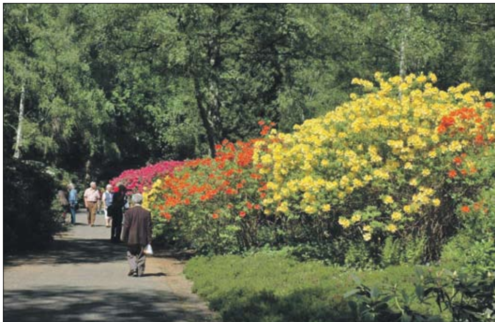
Op 29 augustus de rondleiding 'Japan in Amstelpark' door IVN-gids Arend Wakker