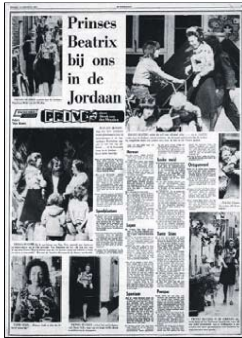
Paginagroot verslag in De Telegraaf van 10 augustus 1973

'In de bevlagde Rozenstraat stond het zwart van de mensen die op het oogenblik dat de stoet de straat inreed een luid gejuich aanhieven. Eenige vrouwen wierpen bloemen in het Vorstelijk rijtuig', zo schreef het Nieuws van den Dag. Regentes Emma liet de directeur weten dat zij de geschiedenis van Ons Huis met