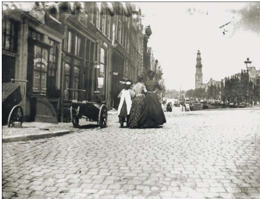
Diensters op de Prinsengracht, foto van G.H. Breitner (ca. 1895)

De muziekgroep Sol y Luna, onder leiding van Indra van Hal, heeft in de 18 jaar van haar bestaan een heel eigen stijl ontwikkeld. Subtiel, poëtisch en authentiek. Betoverend viool- en gitaarspel en hartverwarmende zangstemmen maken Sol y Luna tot een uniek afgestemd ensemble. Een uitgebreid repertoire van de meest gevarieerde melodieën uit Zuid-Amerika, Spanje en Mexico. Uiteraard