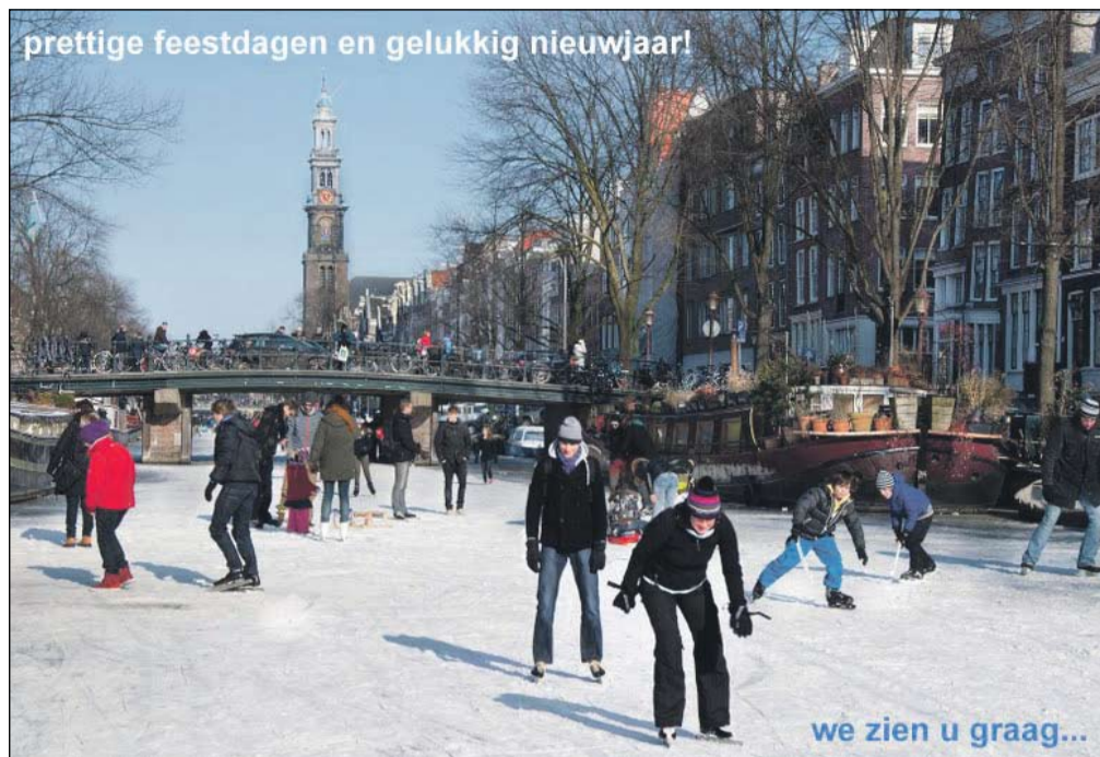
U bent van harte welkom op de Nieuwjaarsreceptie van het Huis van de Buurt op vrijdag 11 januari 2013 van 16.00 tot 18.00 uur. Claverhuis, Elandsgracht 70.