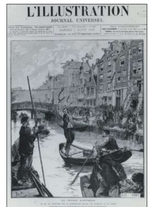
Prent van het Palingoproer in het Franse tijdschrift L' Illustration , augustus 1886