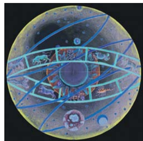
William Law, The works of Jacob Behmen , Londen, 1722. Met de hand ingekleurd.