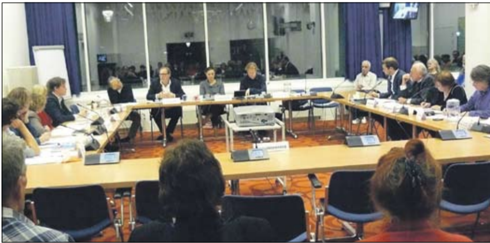
Vergadering commissie Welzijn en Onderwijs op 6 december 2011

Voor meer informatie over La Sirene: www.blondenblauw.nl