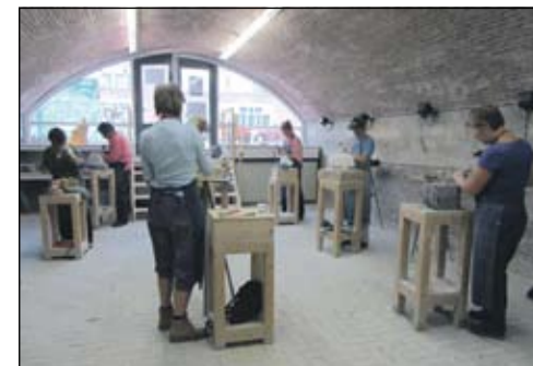
Beginners en gevorderde cursisten werken naast elkaar

Voor uitgebreide informatie: www.atelier-oosterbosch.nl