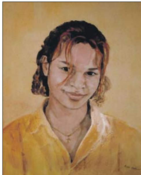
Plantage, Aukje Stokking, aquarel

Als muren konden roddelen... nu siert een soort van treurigmakende Ikea-installatie de wanden van de eens zo beroemde pijpenla. Architectenbureau Concrete heeft de bliksemse boel volgestouwd met houten stellages als open voorraadkasten en enkele stompzinnige opgeblazen foto's van nobodies tegen de muren laten plakken.