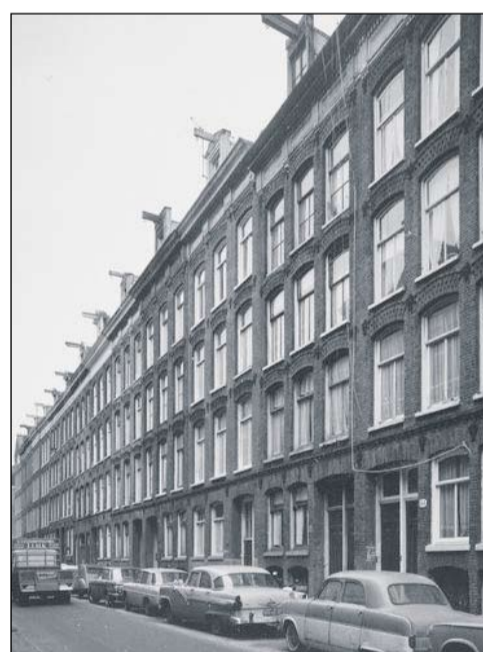
Haarlemmer Houttuinen, jaren '60

Er was veel ongedierte. Ik heb eens meegeemaakt dat er een rat in de schillenemmer zat. Dat merkte ik pas toen ik het beest in de jutezak op mijn rug voelde kruipen. Ik ben toen hard de trappen afgerend. Toen ik de zak