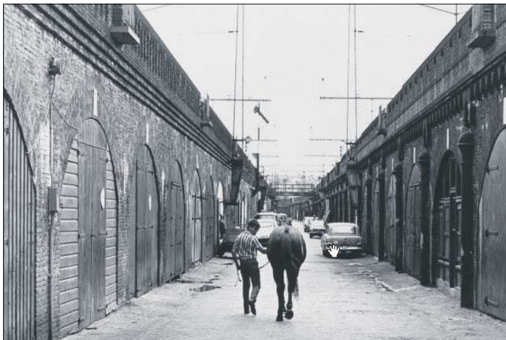
Tussen de Bogen, jaren '60