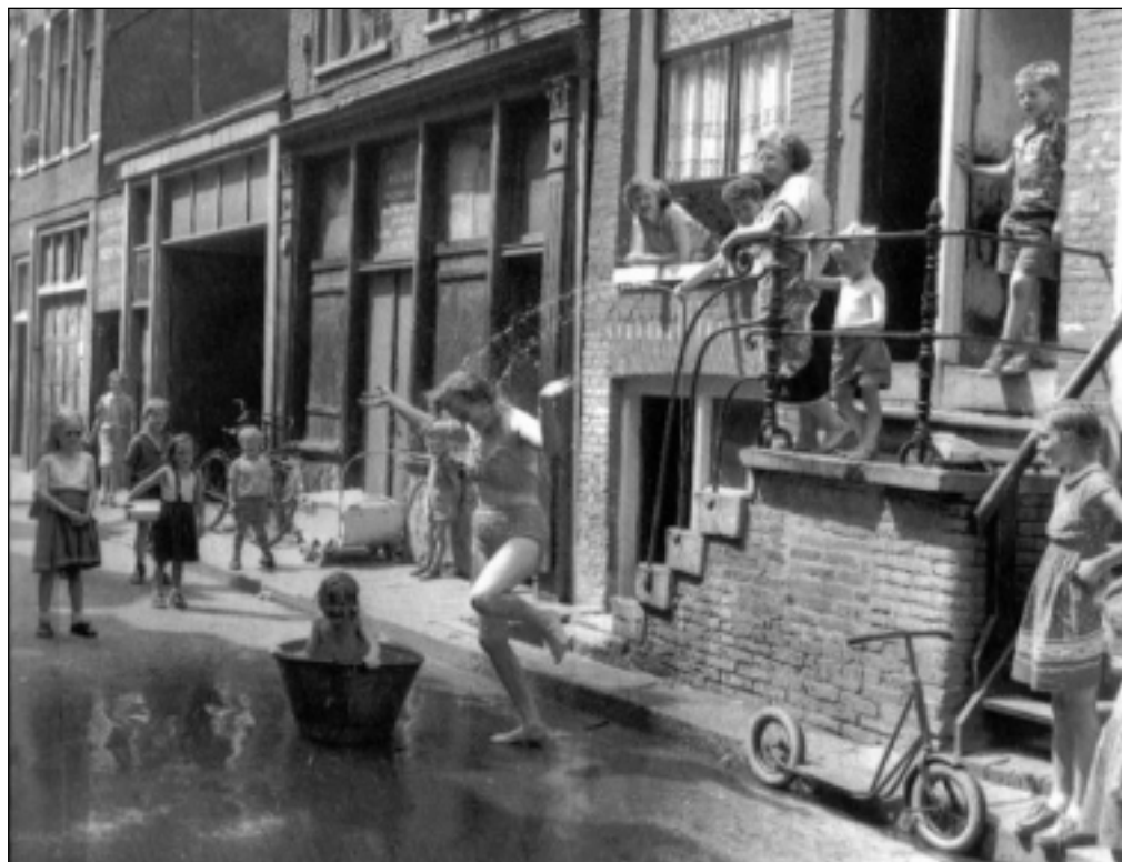
Zomerse waterpret in de Egelantiersstraat, jaren '50

In 50 jaar onderging de Jordaan een spectaculaire metamorfose. Het wijkcentrum speelde er een belangrijke rol in en veranderde mee, al is dankzij de inzet van de buurt gelukkig ook veel gebeven. De veelbezongen krottenwijk, waaruit duizenden bewoners wegtrrokken op zoek naar het geluk in betere buurten – die deels al weer gesloopt worden of reeds zijn! – groeide na het door de buurt zelf afgedwongen bouwen voor de buurt en behoud & herstel, met behoud van de karakteristieke sfeer, kleinschaligheid, dichtheid van bebouwing en het historische stratenpatroon, uit tot één van de meest geliefde wijken van Amsterdam, waar arm en rijk, bewoners en ondernemers, dwars door elkaar en dicht opeen, graag (willen blijven) wonen en werken. De betrokkenheid bij de buurt en bij elkaar is nog altijd opmerkelijk groot en benadert zelfs die in de dorpen in het landelijk gebied van Amsterdam.