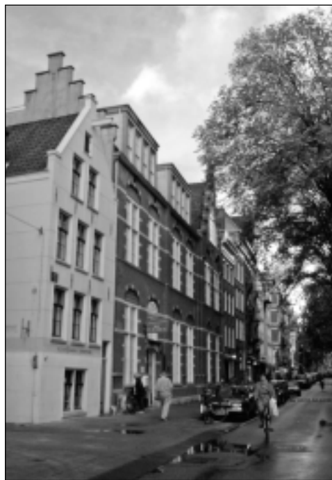
Buurtcentrum Claverhuis aan de Elandsgracht, tweede pand van links

de wensen en noden die leven bij de bewoners en de betrokkenheid van de bewoners bij de buurt en bij elkaar beter te kunnen bevorderen. Buurtcentrum Straat & Dijk wordt dan het Huis van de Buurt in de Gouden Reael. In de Jordaan zijn Wijkcentrum Jordaan & Gouden Reael en Blankenberg Stichting nu nog gehuisvest in dienstencentrum Laurierhof en Stichting Welzijn Binnenstad in buurtcentrum het Claverhuis. De bedoeling is dat de drie organisaties in de loop van 2007 samen in het Claverhuis gehuisvest zullen worden en