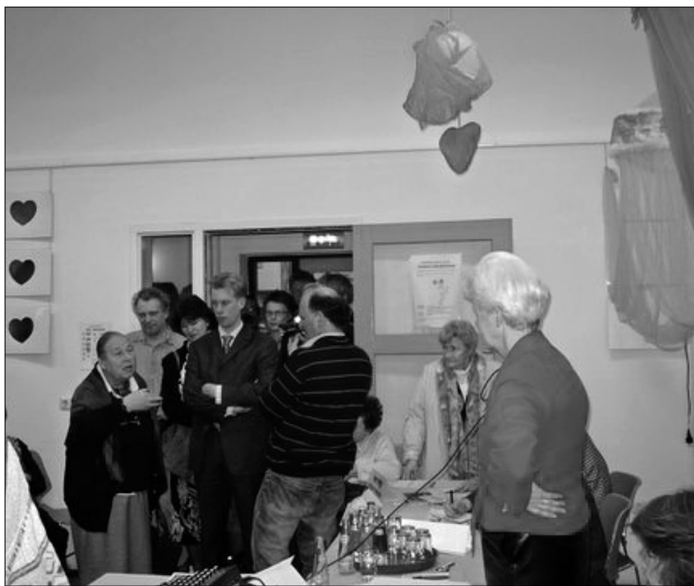
Minister Dekker in discussie met een buurtbewoonster, buurtcentrum Claverhuis 20 februari jl.