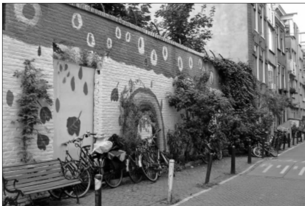
'Herfst in Amsterdam', muurschildering door Marchje Jansen

Wanneer en waar werd al dat fraais voor het eerst bedacht? Veel ervan heeft een stamboom die teruggaat tot in de 18e eeuw, toen dezelfde vormen de paleizen van koningen, hertogen, en baronnen sierden en bij ons de deftige verblijven aan de Herengracht. Het is deze achtergrond van het Jordaanpaleis die zal worden belicht in de lezing van zondag 10 december, 15.00 uur, in Café Duende, door de kunsthistoricus Hans Sizoo.