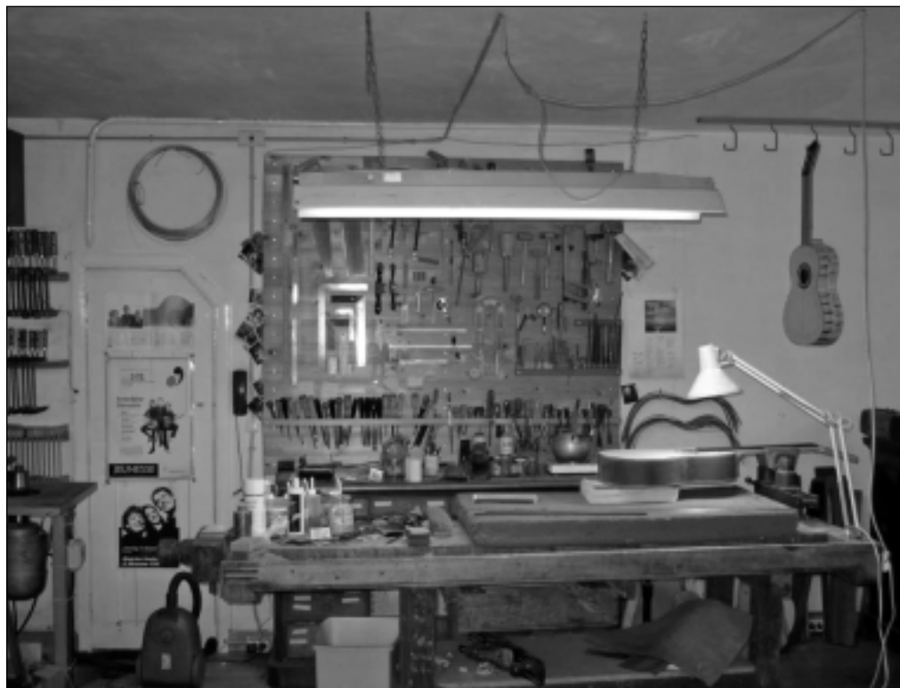
Atelier van Otto Vowinkel: twintig, soms tweeëntwintig gitaren per jaar

lanchole van Soleá. Je verwacht elk moment dat er danseressen op het toneel zullen komen. Toch zit er maar één mijnheer op het podium.') Voor de opleiding van gitaarbouwers bestaan geen mogelijkheden in Nederland, maar voor gitaristen wel. Het Conservatorium in Amsterdam bijvoorbeeld heeft een studierichting gitaar.