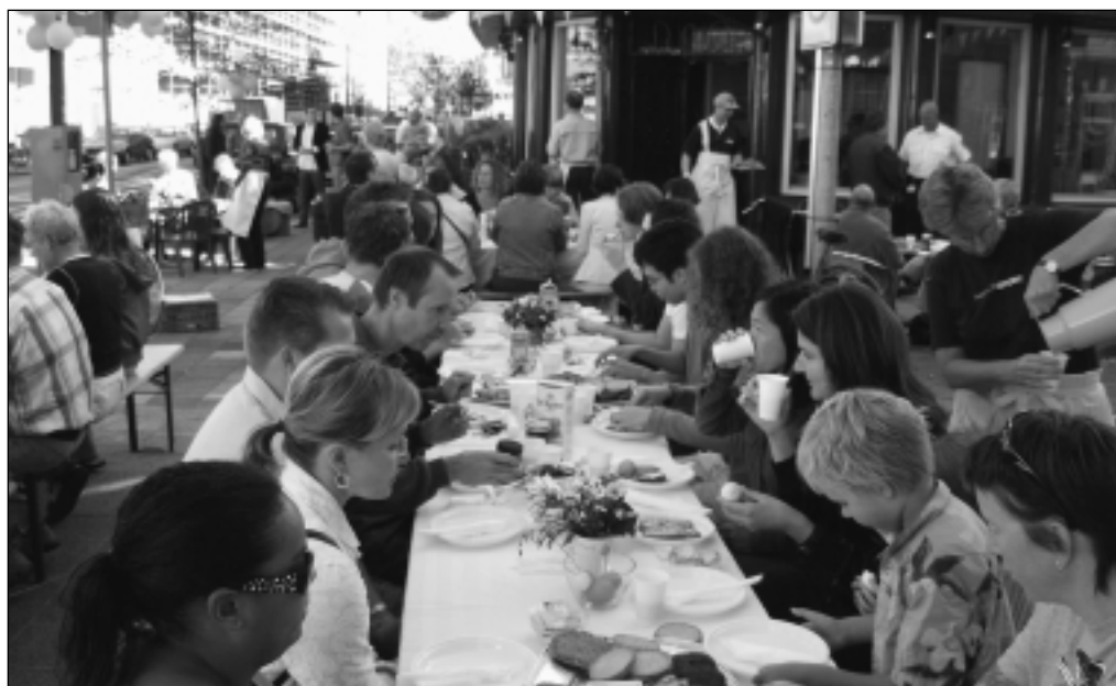
Bammetjes en koffie binden Planciusstraat