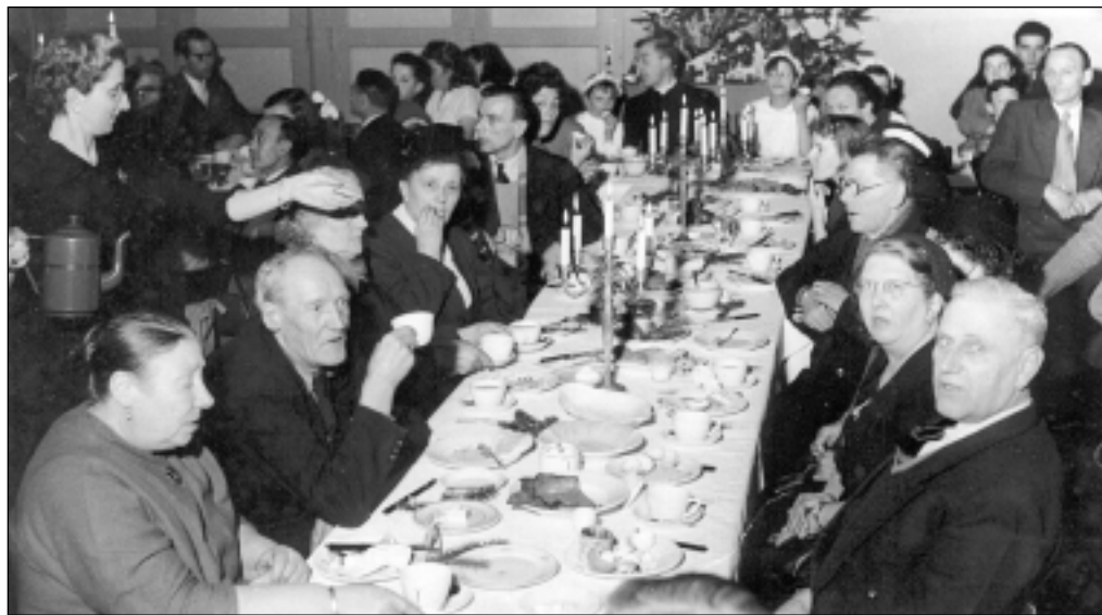
Ook een halve eeuw geleden was versterking van de onderlinge band de inzet