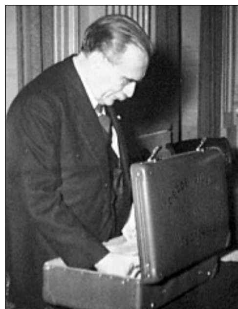
Dr. Willem Drees zag het al aankomen

Officieel is het vastgesteld: met 65 jaar ben je oud. Plotseling hoor je tot een groep die eigenlijk niet meer meetelt, die geld kost, die ziek en zielig achter de geraniums zit en, vooruit, met een kinderkaartje in de tram mag. Sommige oude mensen worden er gedeprimeerd van. Ze voelen zich nutteloos en anderen tot last. Slechter ter been dan toen ze jong waren, gaat hun conditie achteruit. Niet meer zo weerbaar als vroeger, kunnen ze zich minder goed verweren tegen de betutteling die ze soms ervaren. Ze voelen zich overbodig en eenzaam.