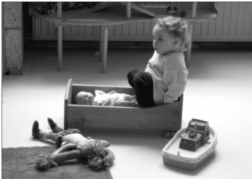
Bij kinderdagverblijf Jor & Daan nog geen kind overboord