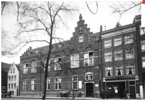
Vervolg van pagina 1

Het buurthuis was een groot succes en niet meer alleen voor jongens. Er werden naast de misvieringen ook bingo-avonden, lezingen, Sinterklaasfeesten en toneel- en filmvoorstellingen georganiseerd. Of de lezing door psycholoog E. Wormer 'Over het vraagstuk Schuld en Boete' (1963) druk bezocht werd is niet bekend.