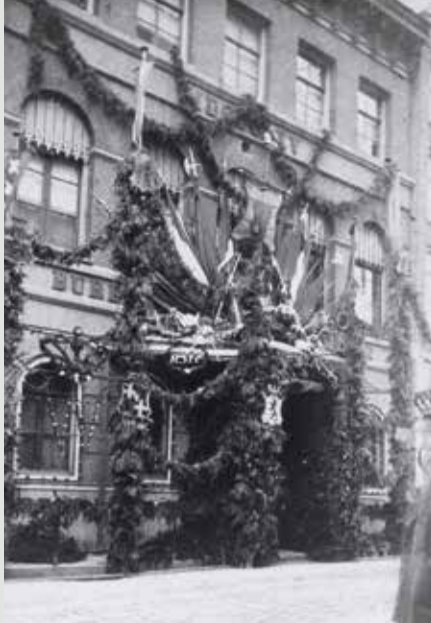
Versiering politiebureau Noordermarkt 1887