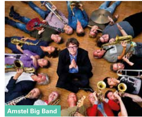
Amstel Big Band

De Amstel Big Band is een zeer ervaren en ambitieus jazzorkest bestaande uit enthousiaste professionals, getalenteerde conservatoriumstudenten en gevorderde amateurs. De bigband bestaat al sinds de jaren tachtig en heeft verschillende markante bandleiders gehad. Sinds 2007 is de bassist en componist/arrangeur Sven Schuster de muzikaal leider en speelt de Amstel Big Band uitsluitend zijn composities, die bepalend zijn voor het eigenzinnige en groovy bandgeluid.