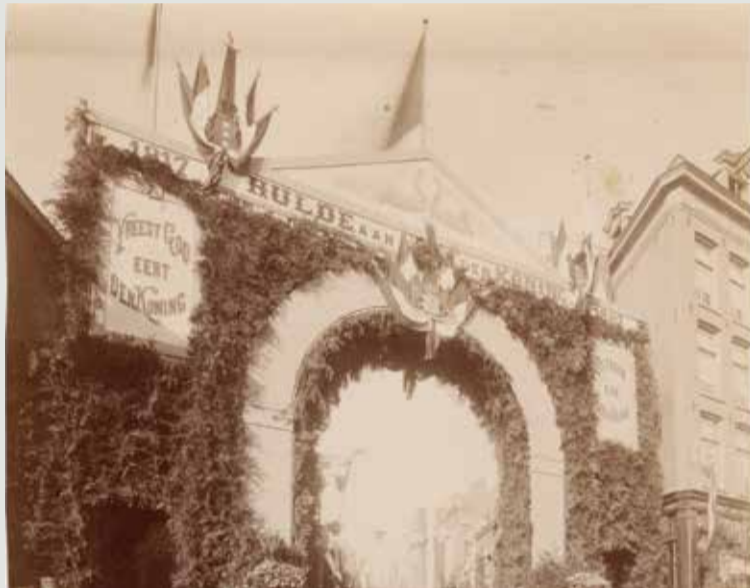
Ingang Willemstraat 1887