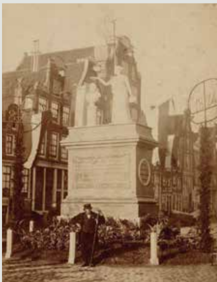
Monument Westerstraat april 1874