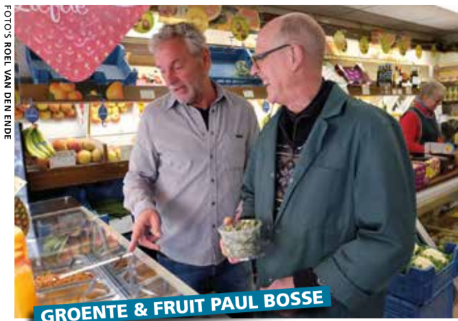
GROENTE & FRUIT PAUL BOSSE