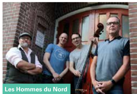
Les Hommes du Nord

Locatie: Looiershof, Passeerdersstraat 16-18