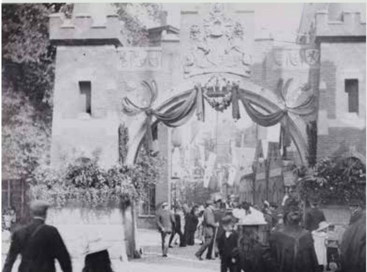
Erepoort Bickersplein 1898