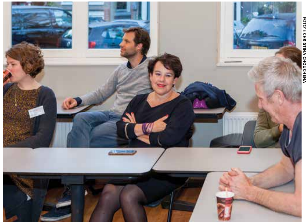
Wethouder Dijkma van Verkeer hoort de wensen van bewoners aan

Als de Marnixstraat een 30km/uur fietsstraat zou worden, dan moeten er maatregelen genomen worden om de straat autolouwer te maken. Er mogen dan namelijk niet meer dan 2500 motorvoertuigen per etmaal door de straat rijden. De wethouder gaat wel onderzoeken of cameratoezicht en flitspalen mogelijk zijn; daarvoor is een ruimere interpretatie van de