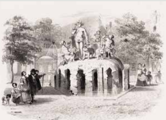
Plaats en Fontein van het Oude Doolhof in 1645.