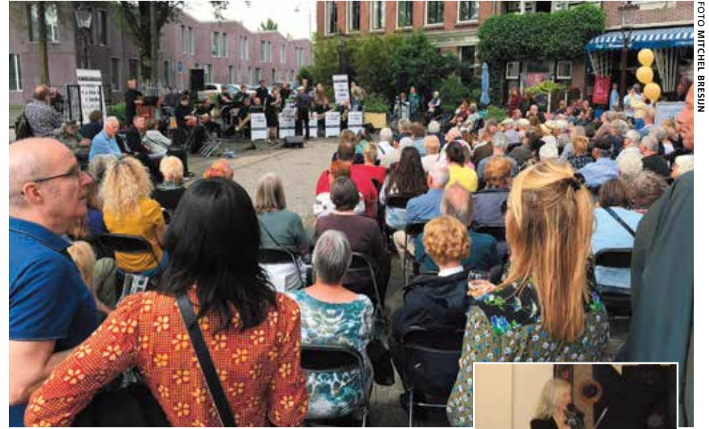
The Cotton Club Big Band op het Hendrik Jonkerplein op Bickerseiland.