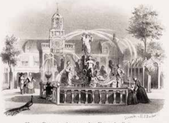
Plaats en Fontein van het voormalige Nieuwe Doolhof.