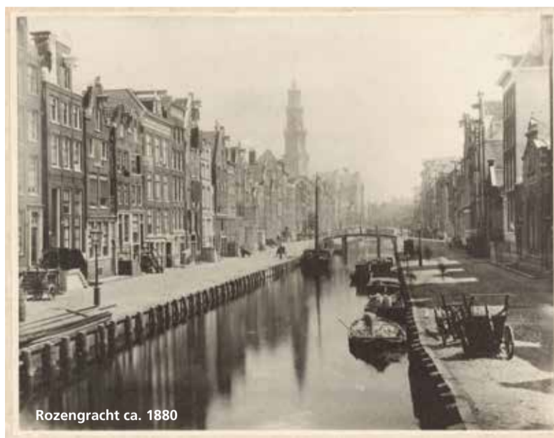
Rozengracht ca. 1880

Het jarenlange actievoeren heeft van enkele bewoners zoveel geëist, dat ze het bijltje erbij neer hebben gooid. Tot februari zal het rustig blijven, want zo lang zetten de coffeshops hun ordedienst in. Dan is er weer overleg met de coffeshops, met de gebiedsmakelaar en met de veiligheidscoördinator van de gemeente. De veiligheidscoördinator kon tot nu toe niet in actie komen, omdat het om een beleidskwestie zou gaan. In het Gebiedsplan 2019 voor Centrum-West staat dat het verbeteren van de leefbaarheid en veiligheid prioriteit heeft. Hopelijk komt er dan in 2020 een oplossing. ■