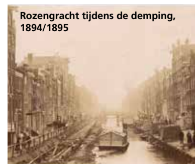
Rozengracht tijdens de demping, 1894/1895