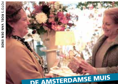
DE AMSTERDAMSE MUIS