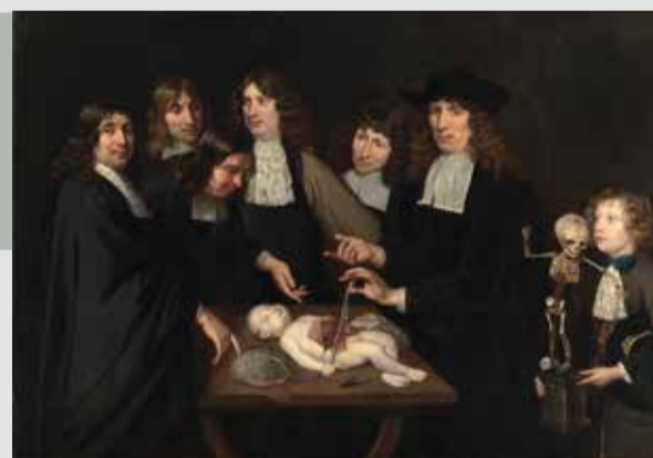
Schilderij van Jan van Neck

Op de Bloemgracht nr. 15 woonde dr. Frederick Ruijsch (1638 - 1731). Hij werd geboren in Den Haag en studeerde medicijnen in Leiden. In 1666 werd hij aangesteld als leraar anatomie en chirurgie bij het College van Chirurgijns in Amsterdam. Tijdens openbare lessen ontleepte hij lijken van misdadigers in het Theatrum Anatomicum in de Waag op de Nieuwmarkt. In 1685 werd hij hoogleraar botanie. Wereldberoemd werd hij door zijn preparaten op sterk water. Hij had het procedé verbeterd en conserveerde vooral lichaamsdelen van kinderen en organen voor onderzoek. Dat deed hij thuis. Kinderlijkjes werden 's nachts per boot aangevoerd. Zijn collectie preparaten stelde hij open voor publiek. Belangstellenden konden 'eenige rariteiten & liefhebberije van de chirurgie' bekijken. Hij kleepte de preparaten vaak aan met een kraagje of manchet om de aanblik minder griezelig te maken en vond ze zelf "bijzonder aangenaam voor het oog." De 'monsters' zette hij op de