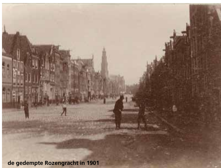
de gedempte Rozengracht in 1901

Bij de stadsuitbreiding en aanleg van de Jordaan aan het begin van de 17 de eeuw werd gebruik gemaakt van het bestaande sloten- en padenpatroon net buiten de stad. Daarbij werd de sloot tussen het Plempenpad en het Pannebackerspad, de Plempensloot, uitgegraven tot de Rozengracht. Aan het einde van de 17 de eeuw werden daar voor het eerst een aantal bomen geplant, maar in de decennia daarna stonden er afwisselend wel en geen bomen. Vanwege de vervuiling, de daarmee gepaard gaande stankoverlast en het toegenomen verkeer werd aan het eind van de 19 de eeuw de op dat moment boomloze Rozengracht, samen met een aantal andere grachten, gedempt. Deze nieuwe verkeersader werd in 1896 bestraat en enkele jaren later, begin 20 ste eeuw, werden er opnieuw bomen geplant. Twee daarvan staan er anno 2019 nog steeds.