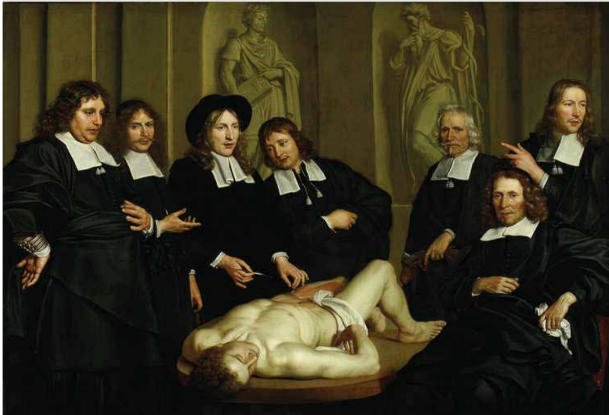
Schilderij van Adriaen Backer