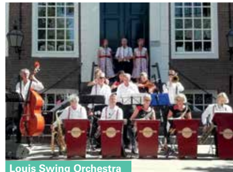
Louis Swing Orchestra

Locatie: Platanenhof, Lauriergracht 99-103