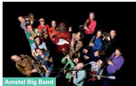
Amstel Big Band

Locatie: Hendrik Jonkerplein t/o café 't Blaauwhoofd, Bickerseiland