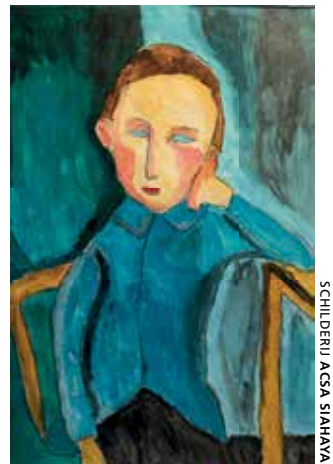
SCHILDERIJ ACSA SIAHAYA

Wil jij als vrijwilliger iets betekenen in ons afasie-atelier? Het is ingrijpend als je na hersenletsel ineens niet meer (goed) kunt spreken, schrijven, lezen of begrijpen wat er gezegd wordt. Deze aandoening heet afasie. Beeldende kunst kan voor mensen met afasie een manier zijn om zich te blijven uiten. Voor de vrijdagmiddaggroep van Acsa zoeken we een gastvrouw of -heer om eens per twee weken handen spandiensten te verrichten. Je werkt altijd samen met een docent-kunstenaar. We kunnen ook vrijwilligers voor onze invalploeg gebruiken. Meer info: www.stichting-marlinefritzius.nl