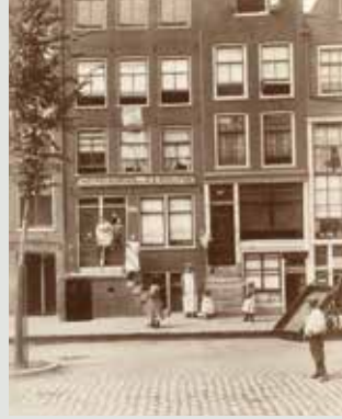
Het sterfhuis van Rembrandt met plaquette in 1906