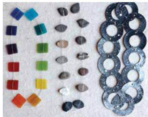
Drie basiskettingen: Hemel, Aarde en Universum

De eerste keer dat ze met glasscherven werkte, was nadat een goede vriend aan alcohol was overleden. "Voor de hele vriendenkring heb ik toen halskettingen van stukjes glas van wijnflessen gemaakt. Dat glas had ik gevonden op het strand van de Middellandse Zee, waar hij graag kwam." Ze kreeg er enthousiaste reacties op. Ze zouden helpen bij het verwerken van het verlies, hoorde ze destijds vaak. Deze 'halskettingen met een verhaal' waren de eerste sieraden die ze maakte. Inmiddels heeft ze er veel meer ontworpen. "The healing power of jewelry", noemt ze dat zelf. Zo maakte ze een Tsunami Remembrance Necklace voor de weduwe van een tsunamislachtoffer. Aan de ketting van staal draad bevestigde ze onder meer zijn huwelijksring en metalen identiteitsplaatje, evenals steentjes van het strand waarop zijn dode lichaam werd gevonden. Zo'n 'geregen verhaal' kan ook een herinnering zijn aan je eigen geschiedenis. 'Je eigen wereld aan een draadje', aldus een van haar poëtische omschrijvingen ervan. In de huwelijksketting voor een Aziatische