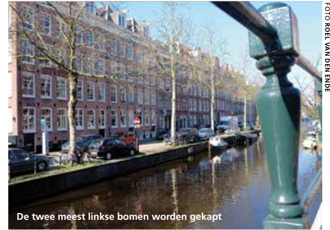
De twee meest linkse bomen worden gekapt

Het zijn er maar twee. Wéér twee platanen die worden omgehakt. Op het totale aantal gekapte bomen stelt het niet veel voor. Maar voor bewoners van de Westerkade is dit een symptoom van een allesbehalve groen beleid.