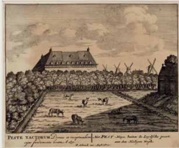
Gravure Pesthuis buiten de Leidsepoort ca. 1709