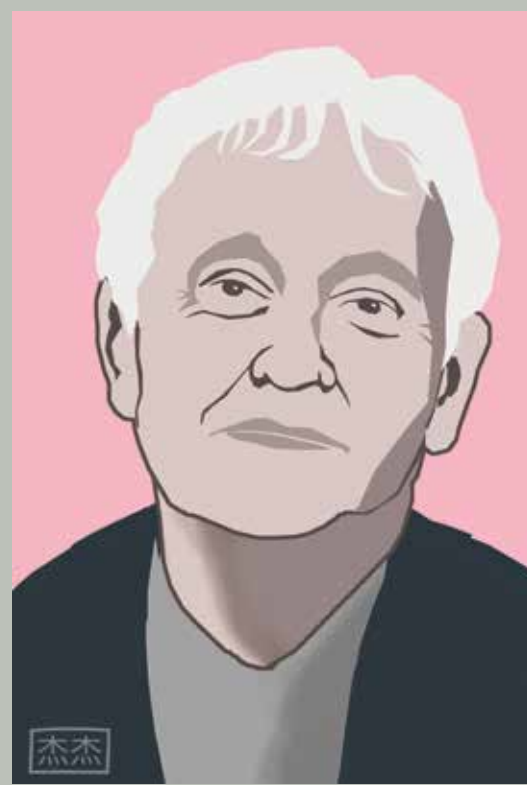
EBERHARD VAN DER LAAN (60 X 40 CM).

Meer info: www.stichting-marlinefritzius.nl