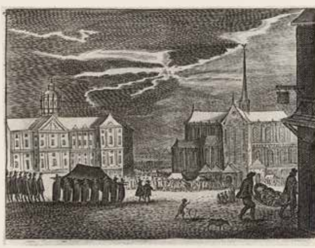
Begravenisstoet op de Dam