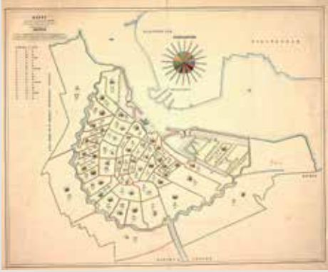
Cholera kaart uit 1867