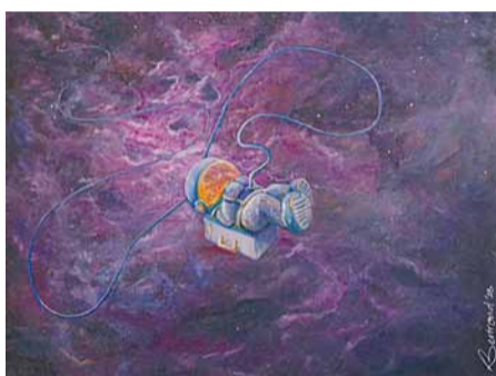
Te bezichtigen tijdens openingstijden. Meer informatie op onze website.

22 februari tot 12 april: Bertrand Sabas