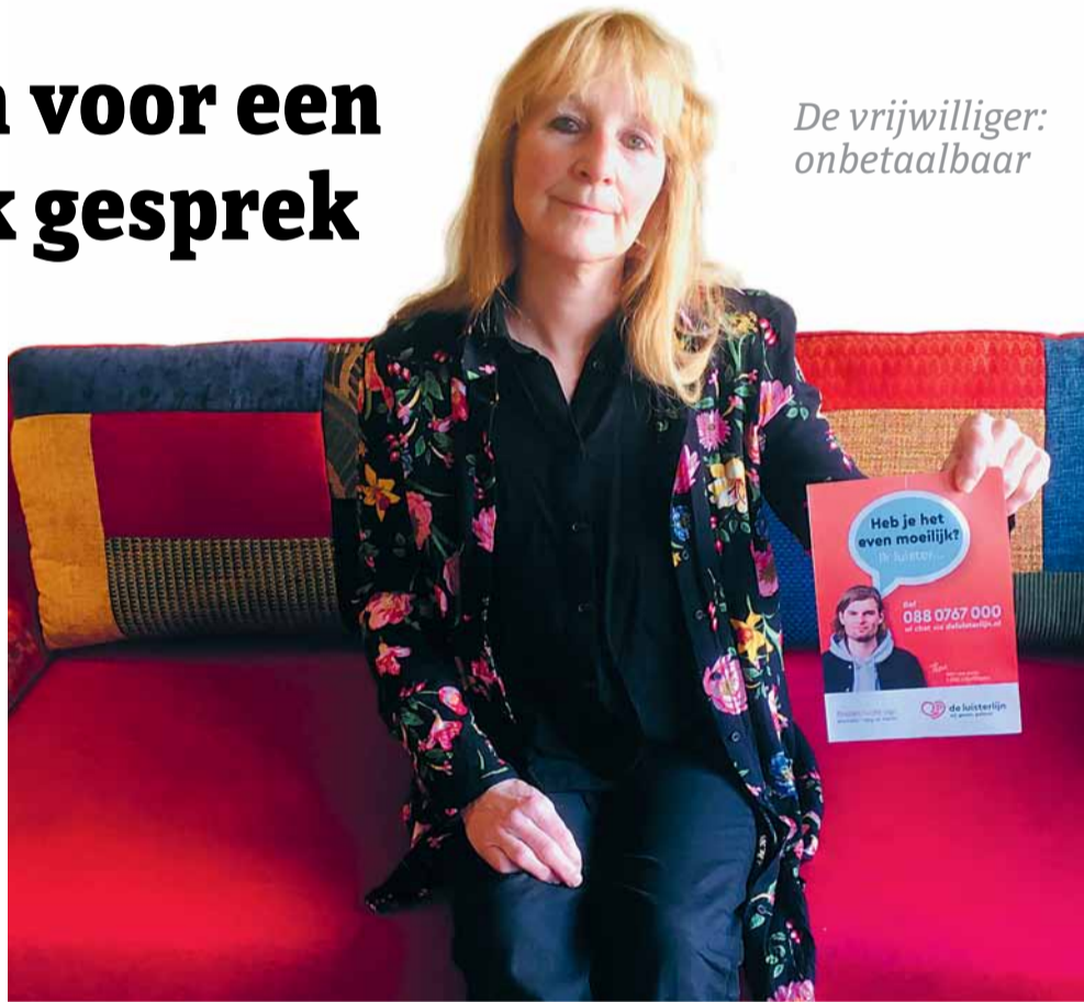
De vrijwilliger: onbetaalbaar

Na afloop van de training kreeg ze een oplaadbare telefoon, een koptelefoon en een modem mee om van huis uit telefoongesprekken te voeren. Hoewel dat ook kan op het Amsterdamse kantoor van De Luisterlijn. "Nee, ik doe