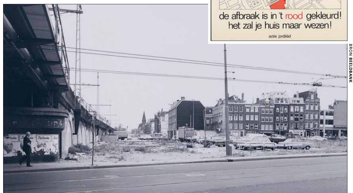
Affiche van de Actiegroep Jordaan